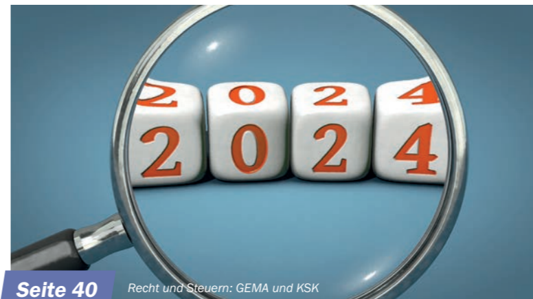
Seite 40 Recht und Steuern: GEMA und KSK