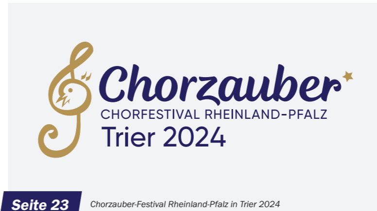
Seite 23 Chorzauber-Festival Rheinland-Pfalz in Trier 2024