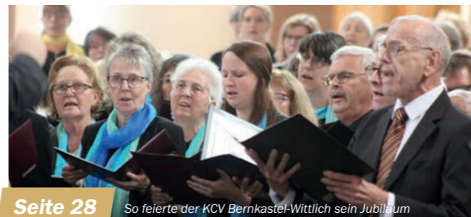
Seite 28 So feierte der KCV Bernkastel-Wittlich sein Jubiläum