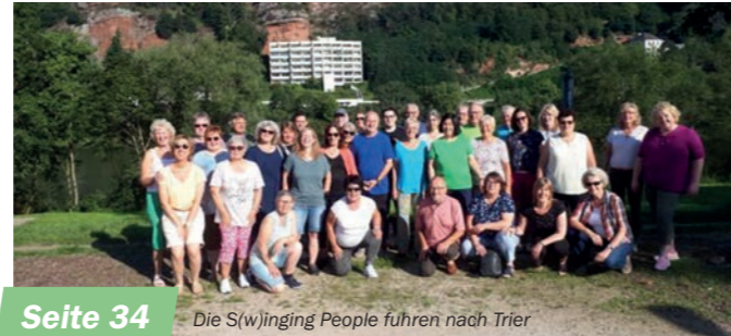
Seite 34 Die S(w)inging People führen nach Trier