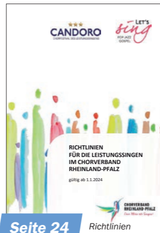
Seite 24 Richtlinien