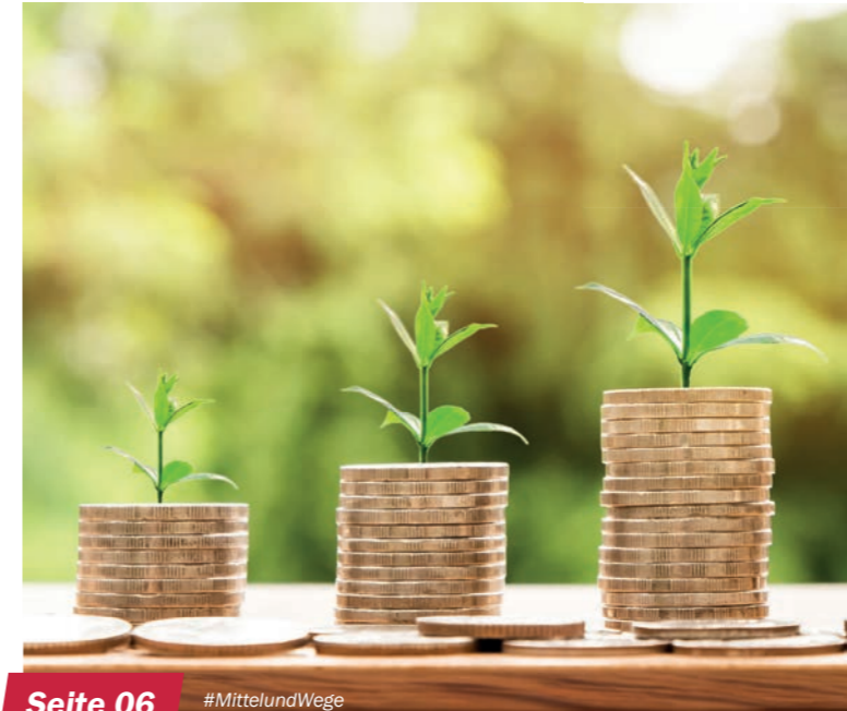
Seite 06 #MittelundWege