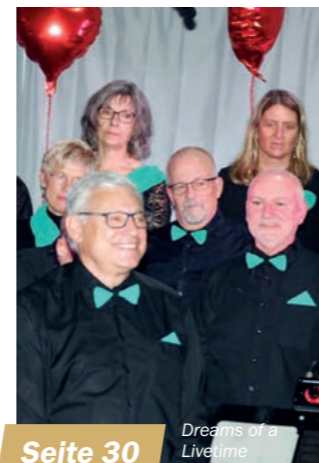
Seite 30 Dreams of a Livetime