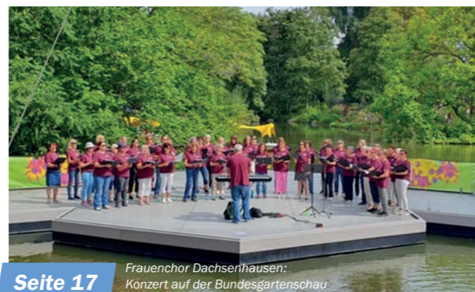
Seite 17 Frauenchor Dachsenhausen: Konzert auf der Bundesgartenschau